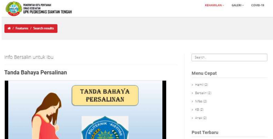
Gambar 5. Tampilan halaman informasi layanan Kesehatan ibu dan anak bagian persalinan

Maka pada pengabdian yang dilakukan saat ini mengimplementasikan layanan tersebut