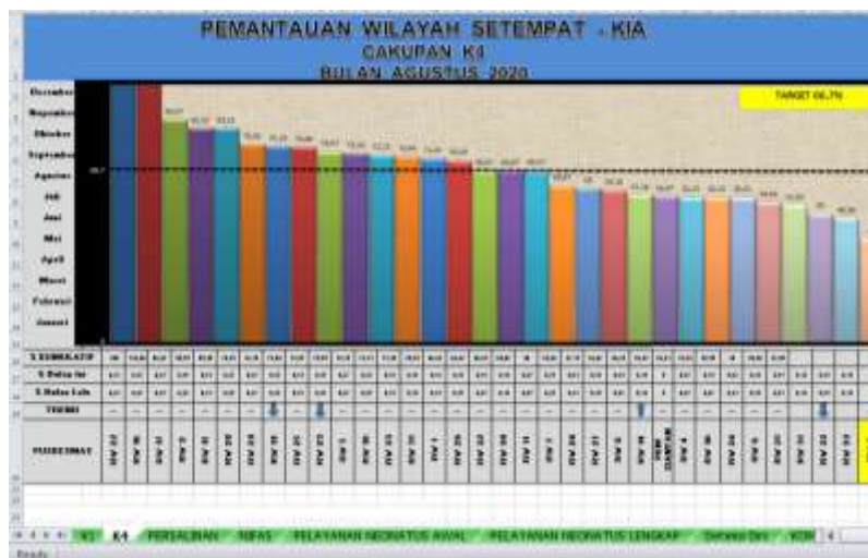
Gambar 2. Grafik pelayanan K4 berdasarkan data per RW 1-33 di Puskesmas Siantan Tengah dari bulan Januari – Agustus 2020