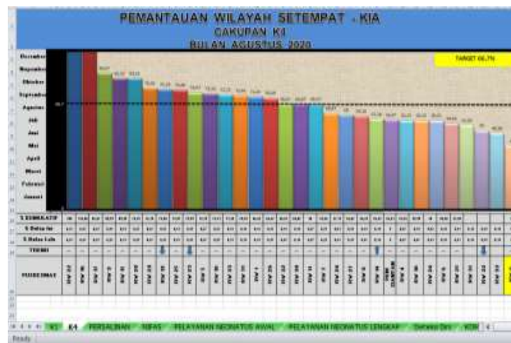
Gambar 1. Grafik pelayanan K4 berdasarkan data per RW 1-33 di Puskesmas Siantan Tengah dari bulan Januari – Agustus 2020

puskesmas siantan tengah Pontianak salah satunya yaitu pelayanan kesehatan ibu dan anak. Untuk mendukung layanan kesehatan dibidang ibu dan anak, puskesmas memiliki tenaga kesehatan bidan berjumlah 5 orang.