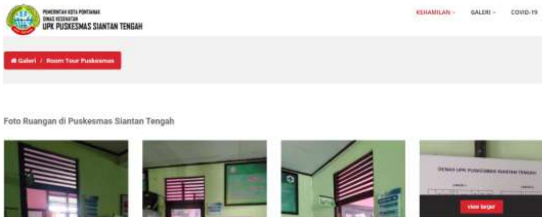
Gambar 6. Tampilan halaman galeri foto ruangan puskesmas