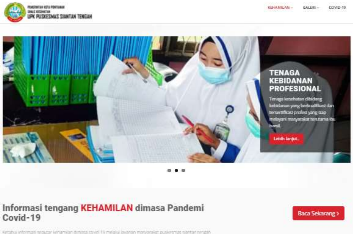
Gambar 4. Tampilan halaman utama website layanan Kesehatan ibu dan anak puskesmas siantan tengah.